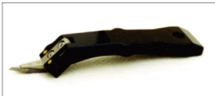
▲ 笹葉刃(内面取り用) 超硬