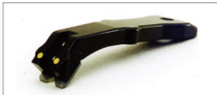
▲ V字刃(外面取り用) 超硬